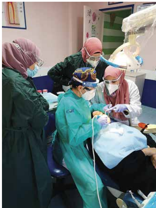
Libano - Formazione COI in ambulatorio