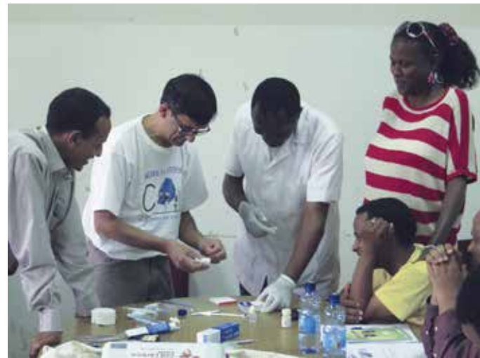
Corso di formazione agli operatori sanitari in Etiopia